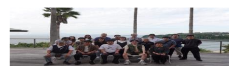
アレグリアガーデンズ天草